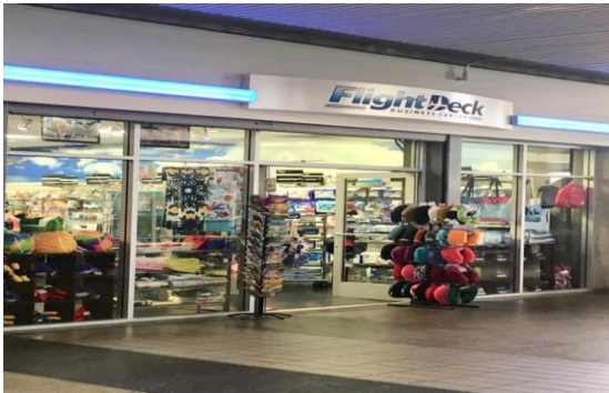
Flight Deck ★1号店 (外見はロケーションにより異なります)